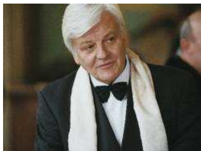
Jacques Perrin ( Benjamin )